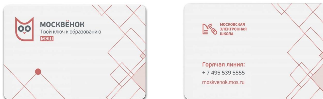
Рисунок 1. Изображение комбинированной карты «Москвёнок» согласно запросу № 64-01- 4331/20 от 12.03.2020 г. (№ 21/1203 от 12.03.2020 г.)

Проверка электронного идентификатора осуществлена отделом сопровождения проектов с использованием электронных карт в образовании.