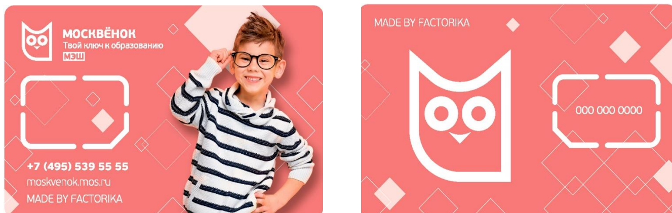
Рисунок 1. Изображение смарт-карты с логотипом «Москвёнок» (дизайн № 2) согласно запросу № 64-01-20955/19 от 29.11.2019 г. (№ 28 -11-19 от 28.11.2019)

Проверка электронного идентификатора осуществлена отделом сопровождения проектов с использованием электронных карт в образовании.