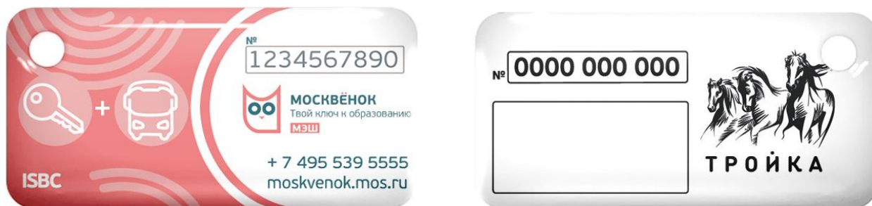
Рисунок 1. Изображение комбинированного брелока «Москвёнок-Тройка» согласно запросу № 64-01- 4334/20 от 12.03.2020 г. (№ 24/1203 от 12.03.2020 г.)

Проверка электронного идентификатора осуществлена отделом сопровождения проектов с использованием электронных карт в образовании.