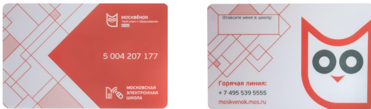
Рисунок 1. Изображение бесконтактной смарт-карты «Москвёнок» согласно запросу № 64-01-439/20 от 13.03.2020 г. (Исх. № 12-03-20-1 от 12.03.2020 г.)

Проверка электронного идентификатора осуществлена отделом сопровождения проектов с использованием электронных карт в образовании.