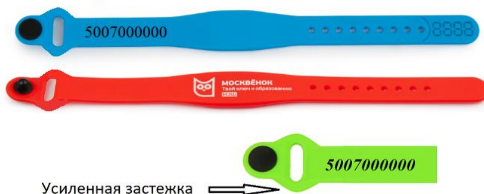
Рисунок 1. Изображение бесконтактного браслета «Москвёнок» (образец № 1) согласно запросу № 64-01- 9898/19 от 27.06.2019 г.

Проверка электронного идентификатора осуществлена отделом сопровождения проектов с использованием электронных карт в образовании.