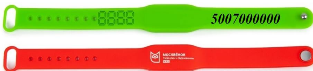
Рисунок 1. Изображение бесконтактного браслета «Москвёнок» (образец № 3) согласно запросу № 64-01- 9898/19 от 27.06.2019 г

Проверка электронного идентификатора осуществлена отделом сопровождения проектов с использованием электронных карт в образовании.