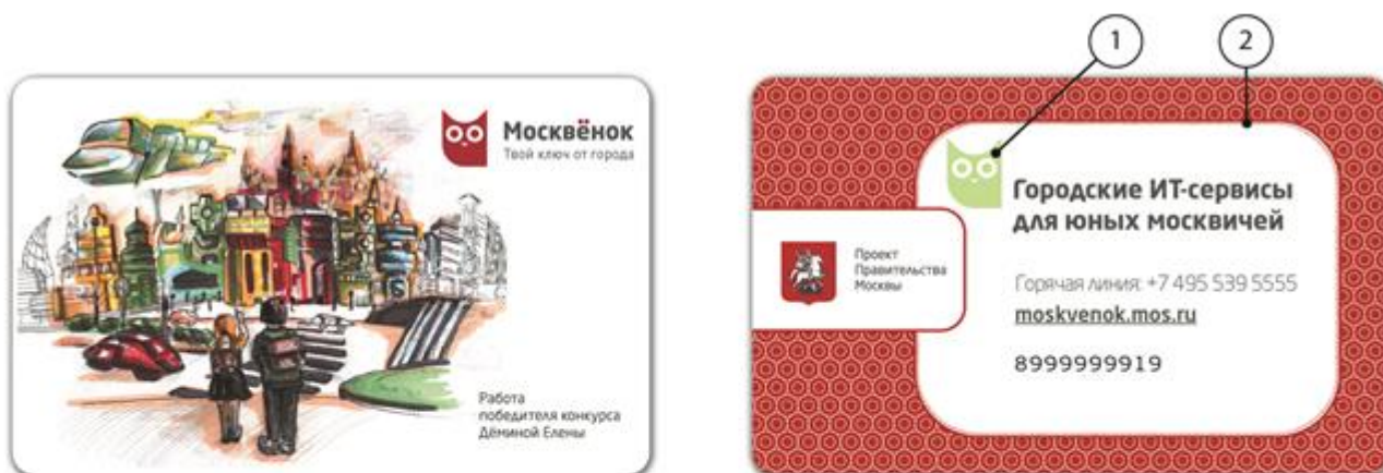
Рисунок 1. Изображение пластиковой бесконтактной смарт-карты ООО «Первый печатный двор» согласно запроса № 64-01-16863/17.